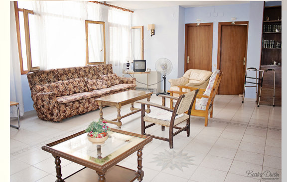
Sala d'estar del segon pis.

La seva cèntrica situació en el cor del Vendrell afavoreix que els residents se sentin plenament integrats en el quefer diari de la vila, envoltats de zones per als viants que els permeten gaudir amb facilitat de passejos pel centre històric així com del seu excepcional clima.