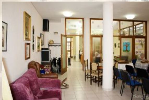
Sala d'estar a la planta baixa

Ofereim una àmplia gama de serveis : estada temporal o permanent, en habitació individual o compartida, així com centre de dia.